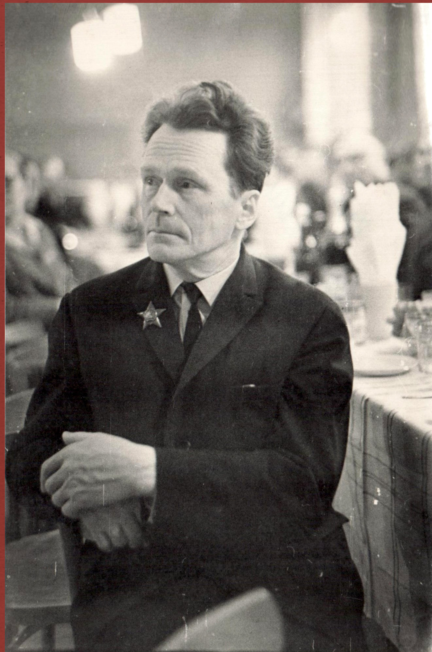
Личный листок по учету кадров (Научной библиотеки ТГУ), 13 апреля 1947 г.