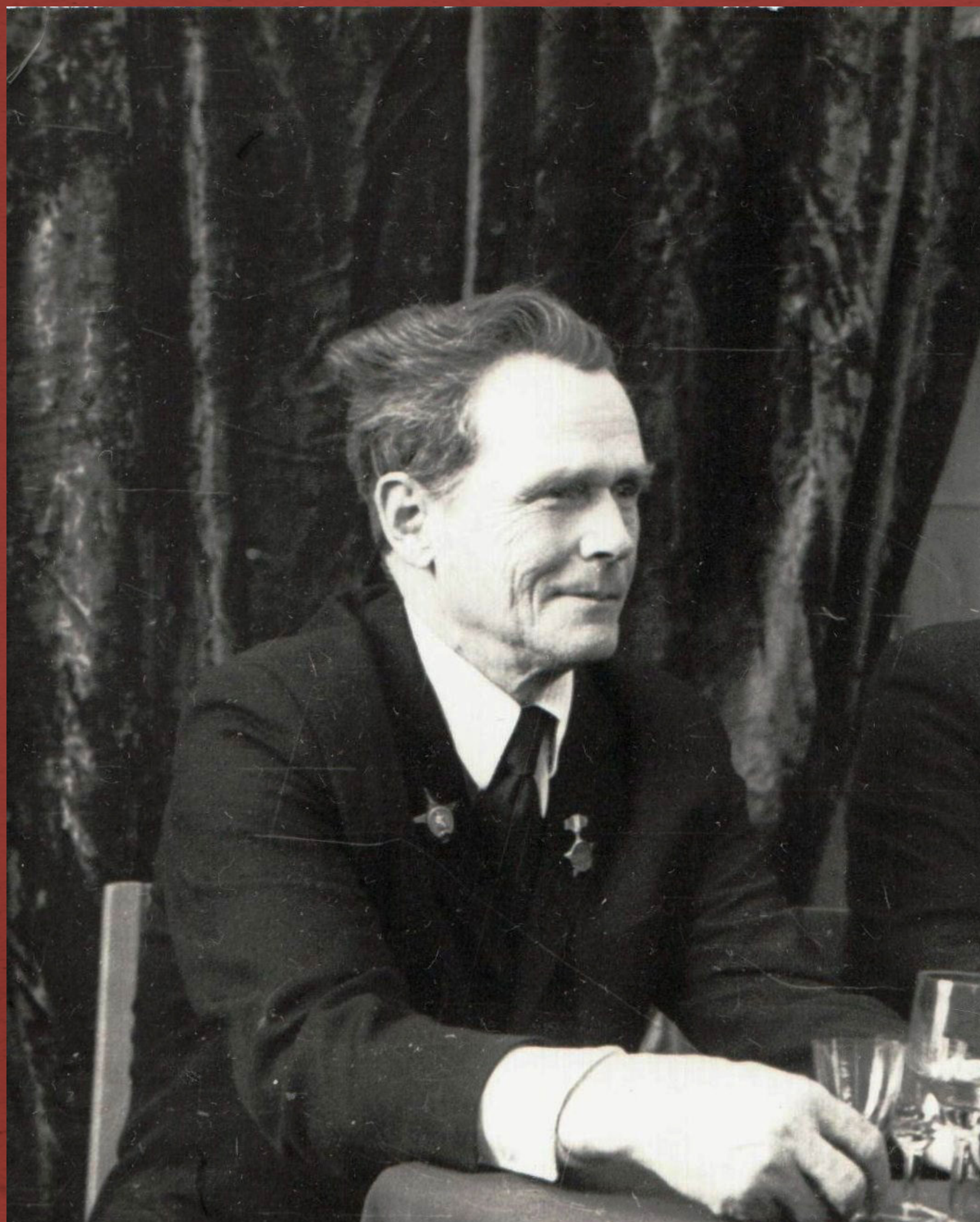
Встреча ветеранов Научной библиотеки ТГУ, 9 мая 1975 г.