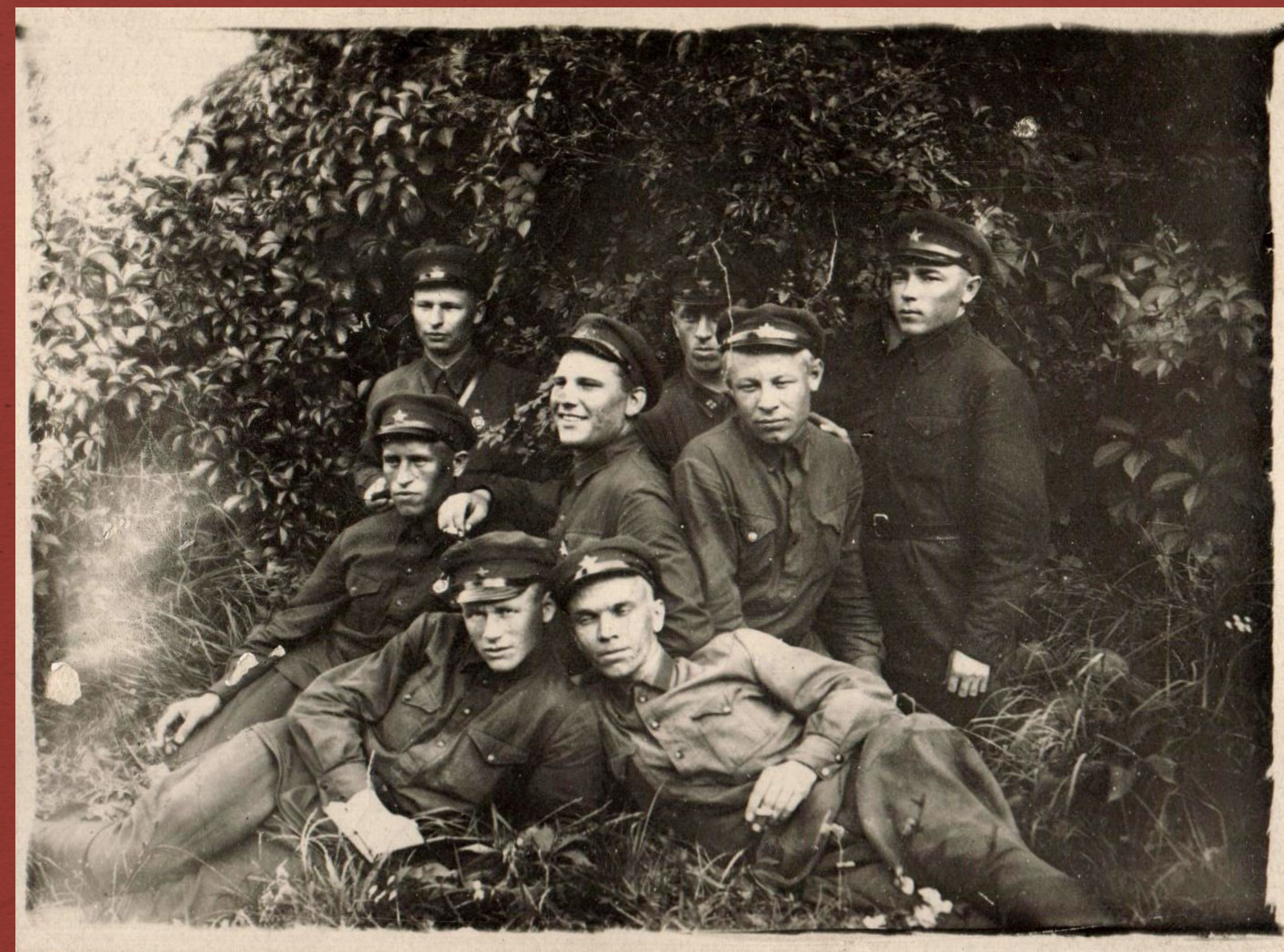
«Волочиск, 1935 г. Группа друзей в парке отряда»