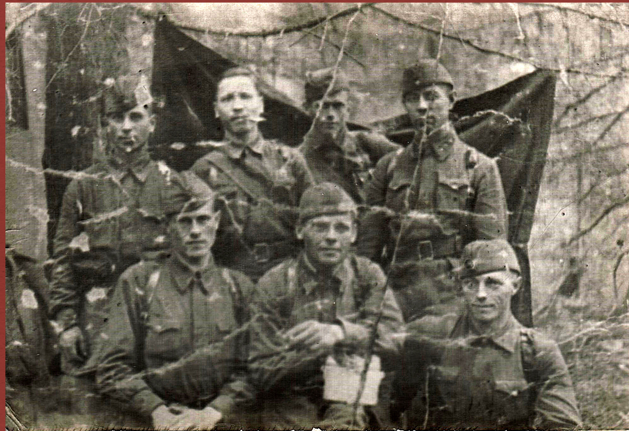
Работники клуба 166-й стрелковой дивизии в октябре 1941 г.