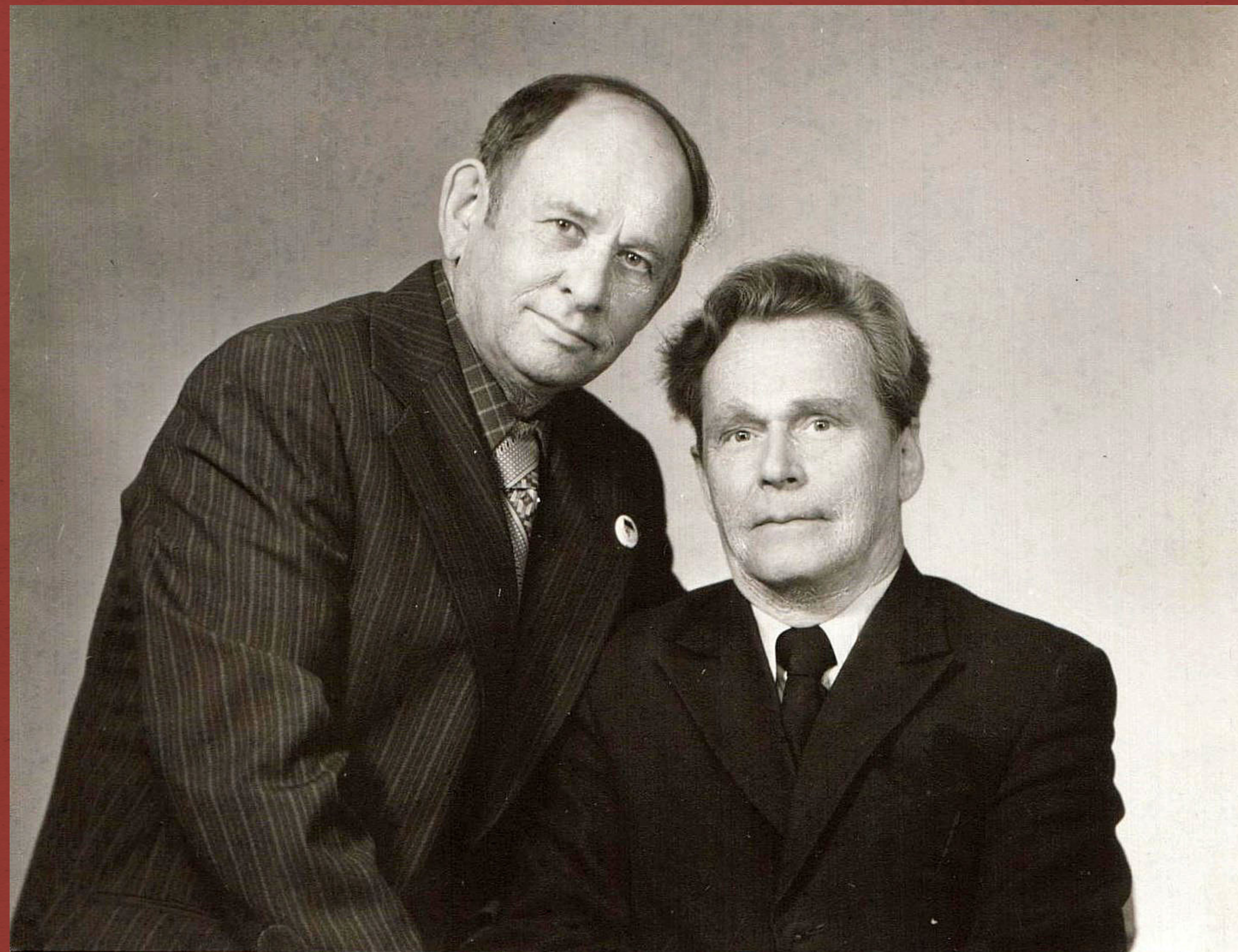
«166 дивизия. Встреча с другом»