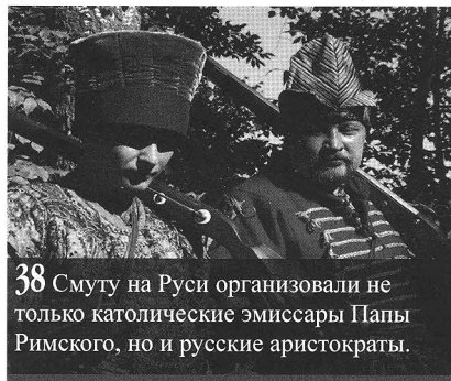
38 Смуту на Руси организовали не только католические эмиссары Папы Римского, но и русские аристократы.

22 БИБЛИОТЕЧНЫЙ ПРОЕКТ/ МНЕ НЕТ НУЖДЫ ПРИТВОРЯТЬСЯ