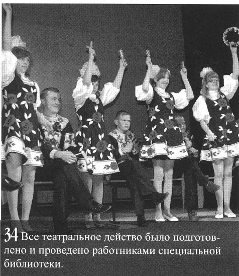
34 Все театральное действо было подготовлено и проведено работниками специальной библиотеки.