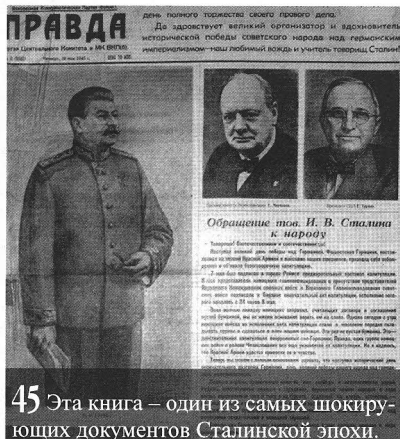
45 Эта книга – один из самых шокирующих документов Сталинской эпохи.