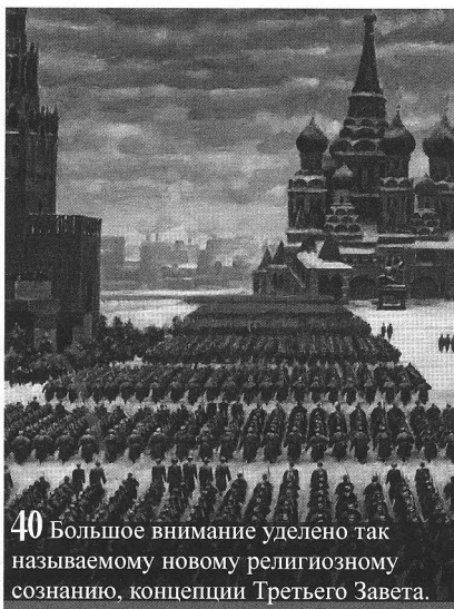
40 Большое внимание уделено так называемому новому религиозному сознанию, концепции Третьего Завета.