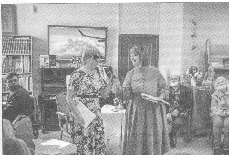
На фото: атмосферное мероприятие в ТОСБС, сопровождаемое тифлокомментированием ►

Обе статьи в рубрике затрагивают одну проблему. Речь идёт о тифлокомментировании – социальной услуге, востребованной не только в стенах библиотеки, но и в других учреждениях культуры. Авторы говорят о том, как пояснительная речь помогает людям с проблемами зрения познавать мир, рассказывают о подготовке волонтеров в данной сфере, приводят важные принципы построения описательных монологов. Вся эта работа позволяет слепым и слабовидящим получать удовольствие от походов в театр, посещения выставок, экскурсий.